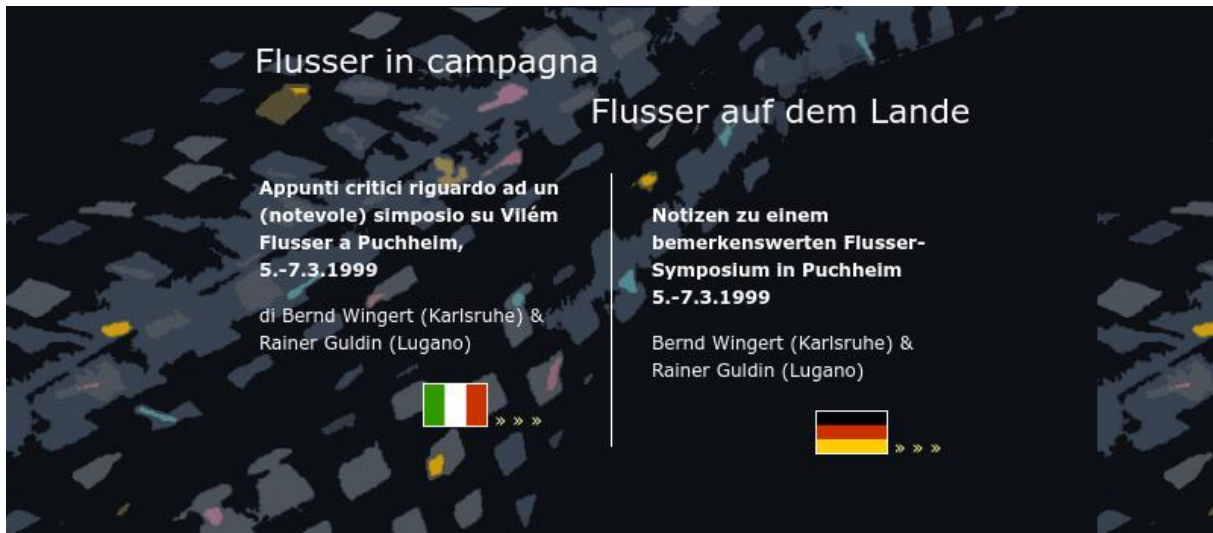
Abbildung 5: Die Flusser Files „Symposium Puchheim – 3/99“