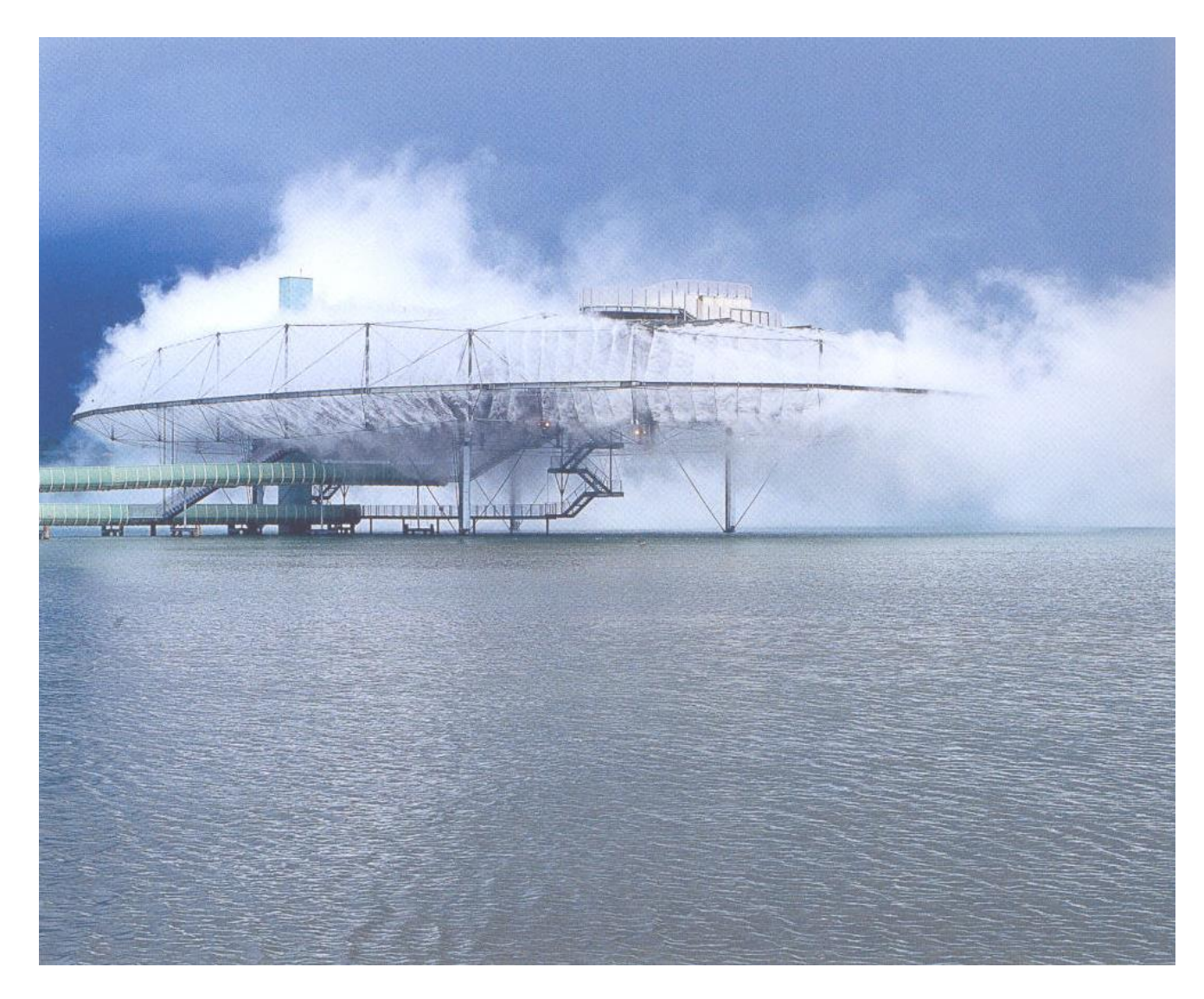
Diller & Scofidio, Blur Building